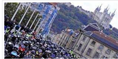
Manifestation régionale des motards en colère à Lyon