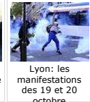
Lyon: les manifestations des 19 et 20 octobre